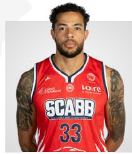
JITO KOK POSTE 5