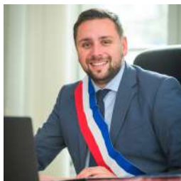
Axel DUGUA , Maire de Saint-Chamond - 1er Vice-Président du SIPG